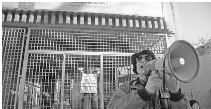
Encierro en el SAE. Asamblea 15M Cerro-Amate

En noviembre de 2011 en Sevilla se producen casi a diario manifestaciones y concentraciones. Hay un ERE en marcha en una subcontrata de comunicaciones, SERTEL. Los estudiantes de la universidad de Sevilla convocan una huelga para el día 17. La Inter comisión laboral del 15M apoya a los trabajadores de la empresa de recreativos COFISA, que están en huelga por incumplimiento de convenio y despidos. Manifestación de trabajadores de Mercasevilla el día 14 de noviembre ante el anuncio de su venta poniendo en peligro las prejubilaciones.