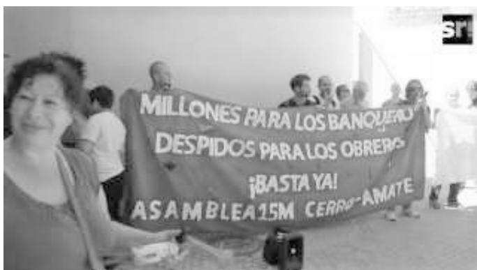
Fotos tomadas durante el encierro de trabajadores en el Servicio Andaluz de Empleo del distrito, organizada por la comisión laboral de la Asamblea 15M Cerro-Amate