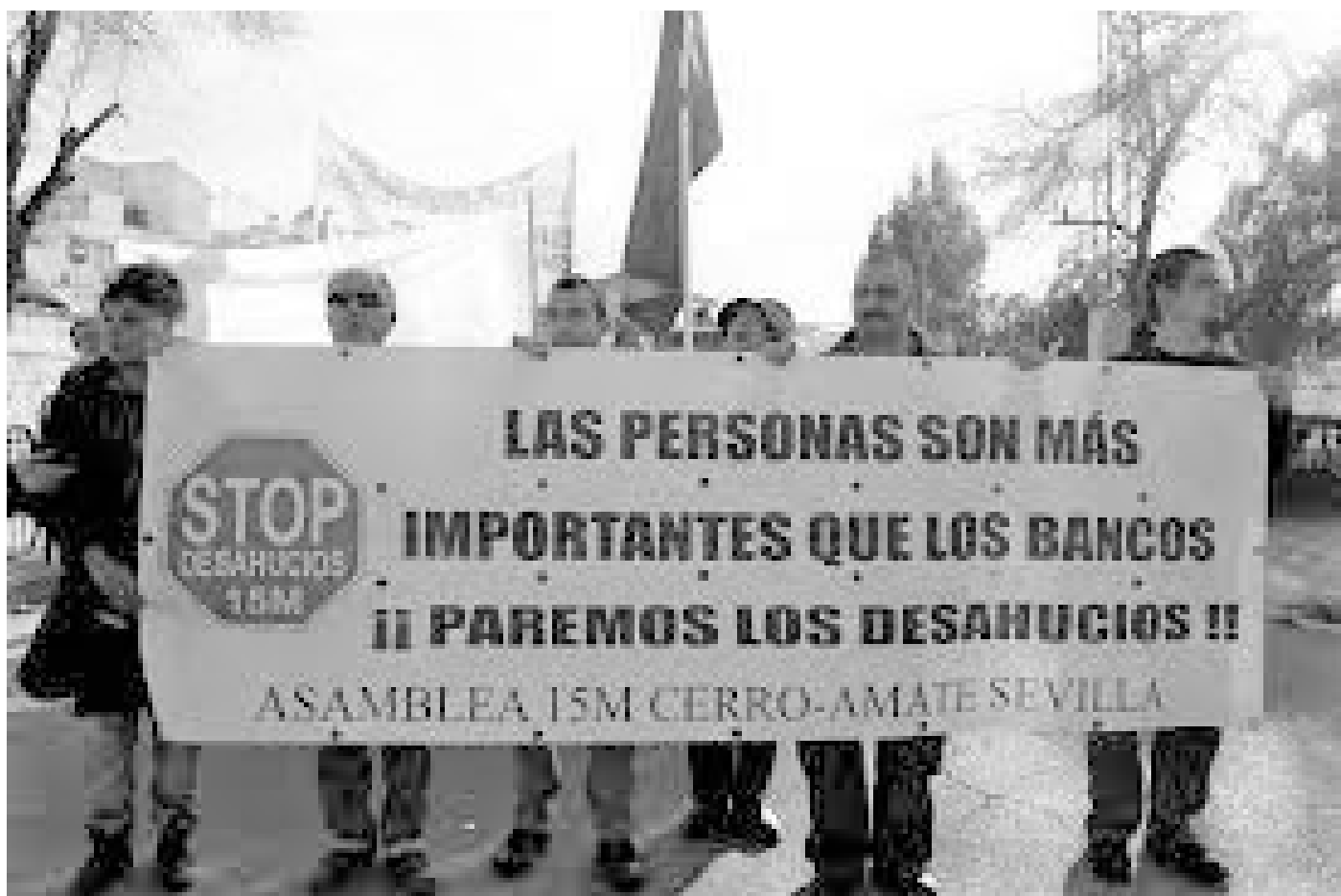
Asamble 15M Cerro-Amate en una denuncia contra los desahucios