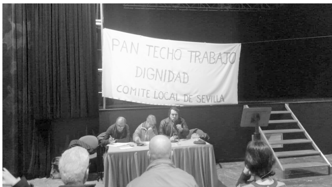
Asamblea de Trabajadores en Lucha. Asamblea 15M Cerro-Amate

la lucha contra los ataques de la patronal. Extender las luchas y llevar a la movilización general eran los objetivos primeros de esta asamblea.