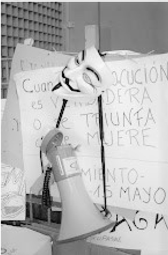
Fotos tomadas durante el encierro de trabajadores en el Servicio Andaluz de Empleo del distrito, organizada por la comisión laboral de la Asamblea 15M Cerro-Amate