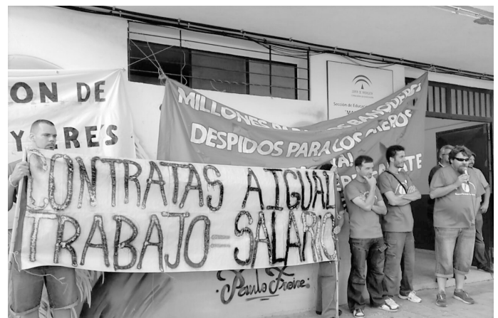
Protesta de trabajadores de las subcontratas de Telefónica. Asamblea 15M Cerro-Amate

En las sesiones de trabajo de esa comisión se discute la estrategia de la ocupación, se ofrecen voluntarios, compañeros y vecinos que están en el paro. Se discuten los pros y los contras de un encierro que puede ser que se prolongue durante uno o dos meses. Tres serán los compañeros que se encierren en las oficinas de empleo, aunque uno de ellos la abandonaría más tarde por problemas de salud. En principio, la duración del encierro está condicionada a un posible desalojo forzoso por parte de la policía.