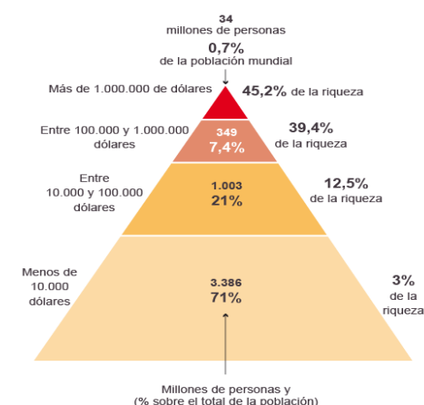
► LA PIRÁMIDE DE LA RIQUEZA GLOBAL

Así que lo que se puede desear para 2017 es que los trabajadores utilicen su fuerza, este papel central e indispensable en la economía, porque producen todas las riquezas; que la utilicen para defender sus intereses, llevando a cabo la lucha de clases y poniendo en tela de juicio el orden capitalista que está amenazando de muerte a toda la humanidad.